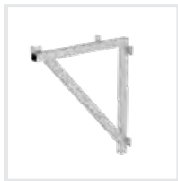
Dreieckskonsole Bestell-Nr. 600100 – 600102, 600129