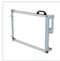
Sicherungsschranke Bestell-Nr. 690746 – 690748