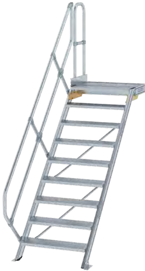
Abb. Bestell-Nr. 600449